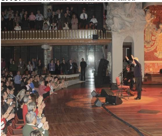
2008. Concert del Centenari del Palau