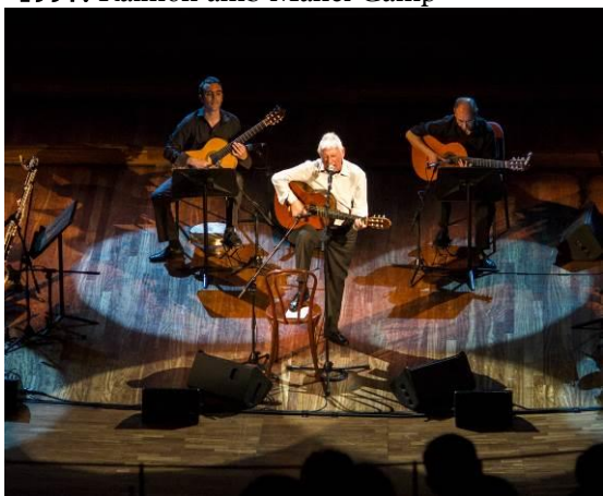
2014. Concerts antològics al Palau