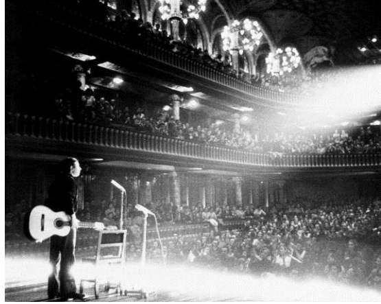
1967. Primer recital en solitari al Palau