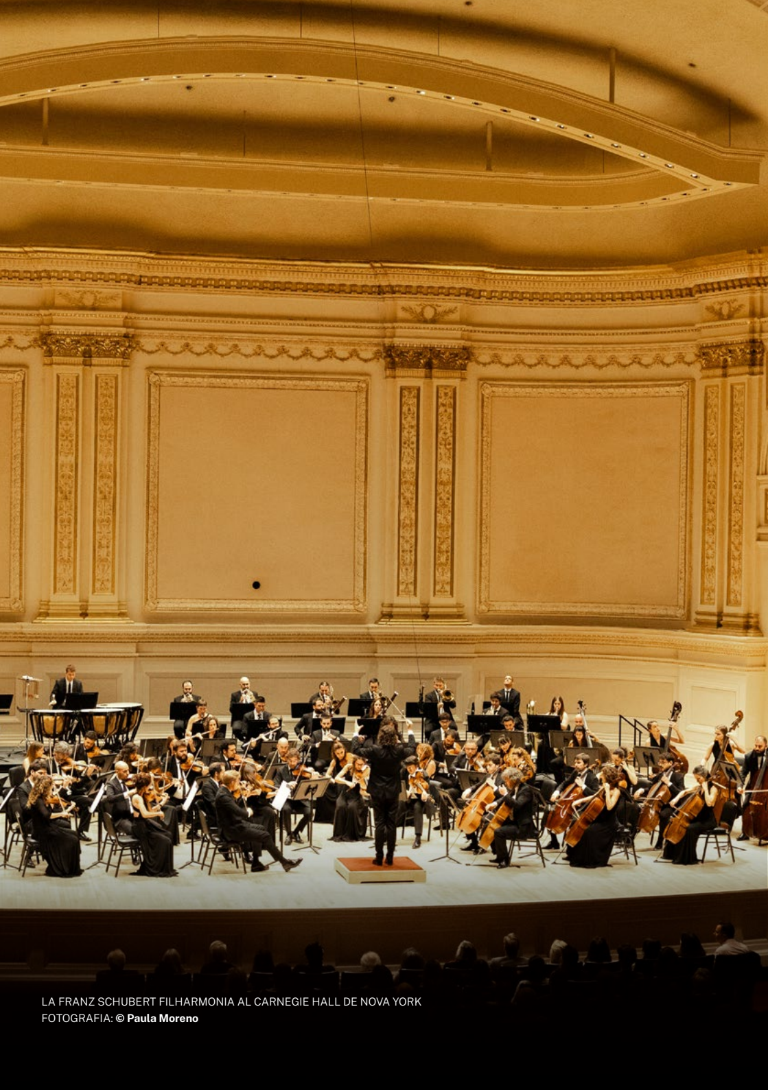
LA FRANZ SCHUBERT FILHARMONIA AL CARNEGIE HALL DE NOVA YORK