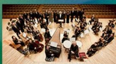
13.08.24 Bach Collegium Japan