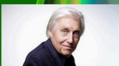
11.08.24 Orchestra Simfònica del Vallès & Joaquín Achúcarro