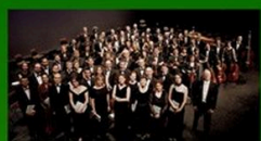
10.08.24 Les Arts Florissants Le Jardin des Voix